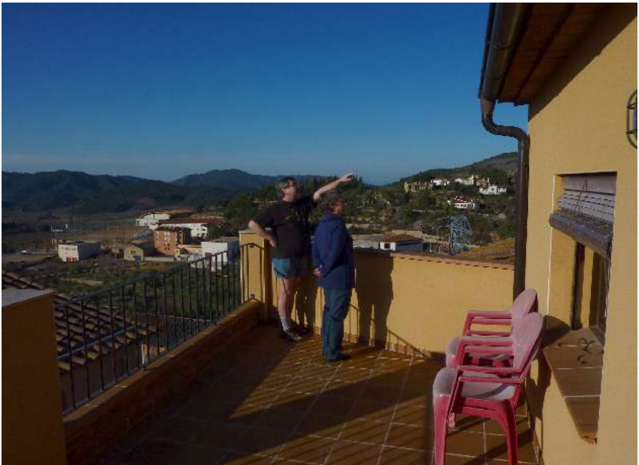
Blick von der Terrasse der obersten Wohnung im Casa Estivill in die Umgebung. (N&WK)