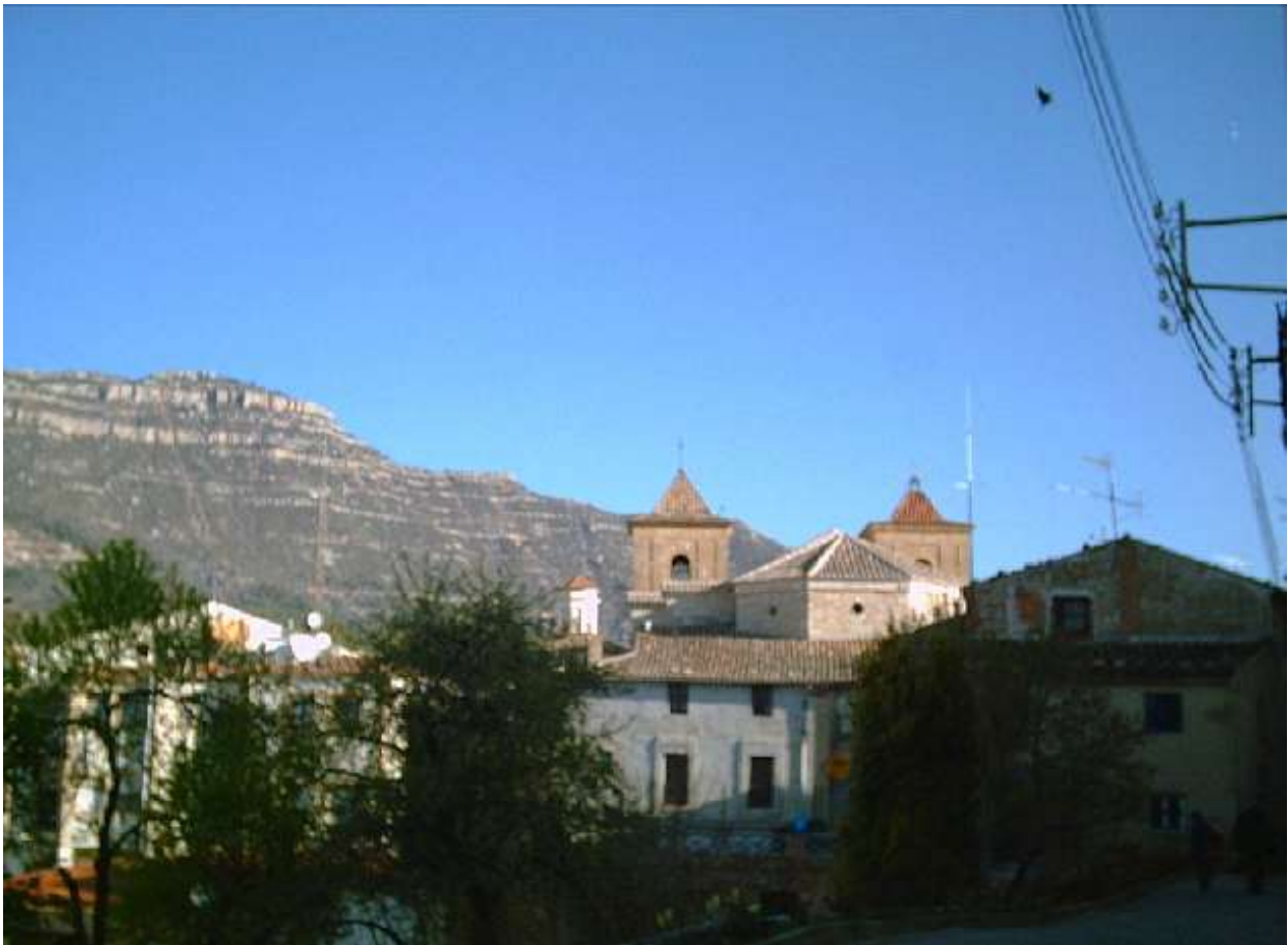
Cornudella del Montsant im zeitigen Frühjahr...