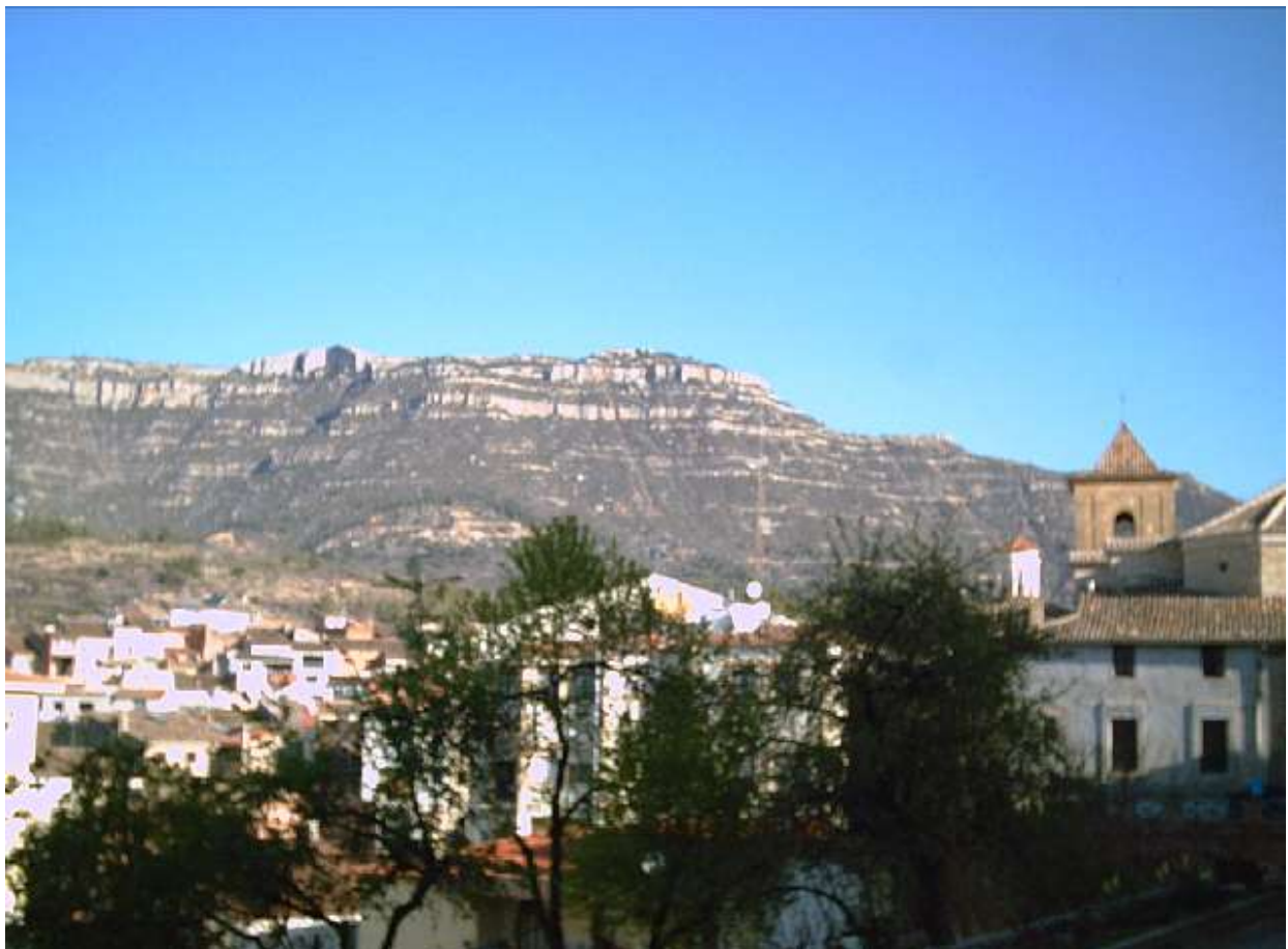
... und schon das gleißende Licht hier.