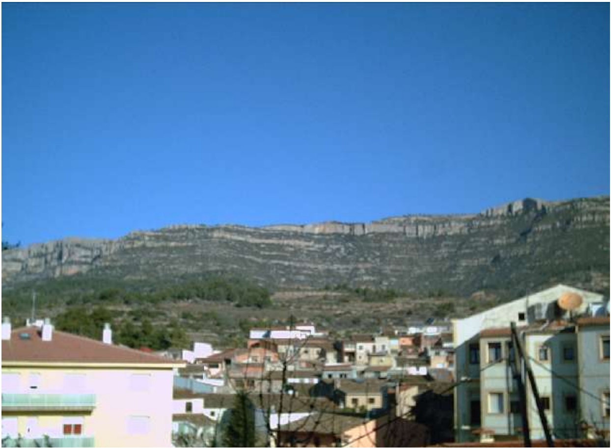
Der Blick auf das Montsantmassiv ist allgegenwärtig.