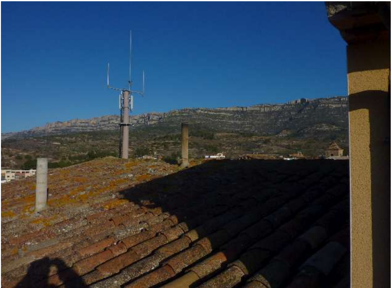
Auch von unserer Unterkunft in Cornudella del Montsant genießen wir herrliche Blicke. (N&WK)