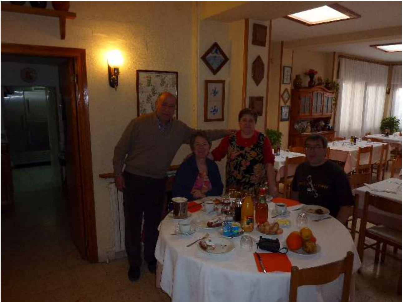
Im März 2012 wurden wir ganz herzlich im Fonda El Reco verwöhnt.