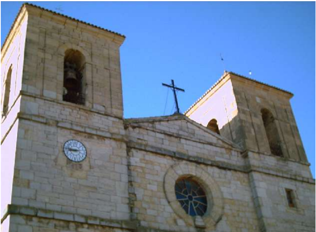
Das Ortsbild wird jedoch entscheidend von der recht großen Kirche geprägt.