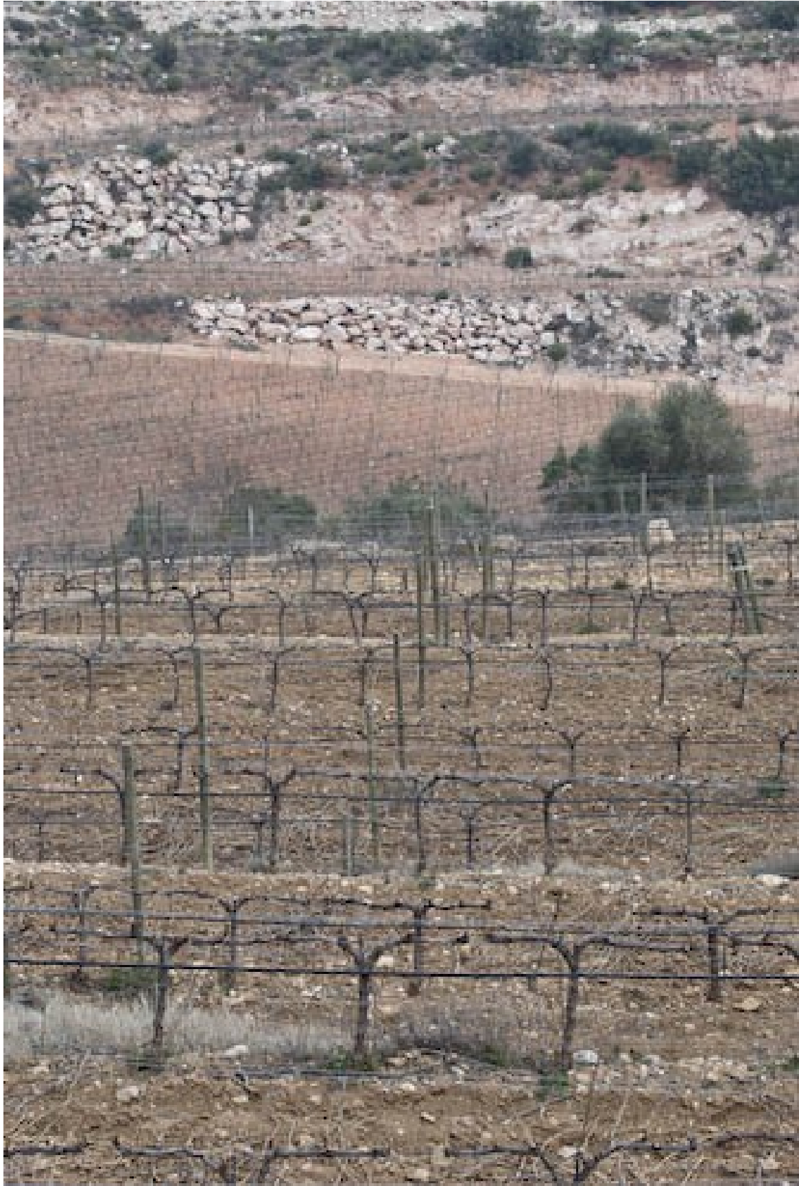
Dazwischen jede Menge Kieselsteine aller Größen.