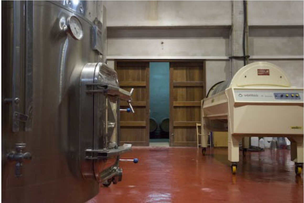
Modern und sauber – der Keller der Bodegas Ametller.