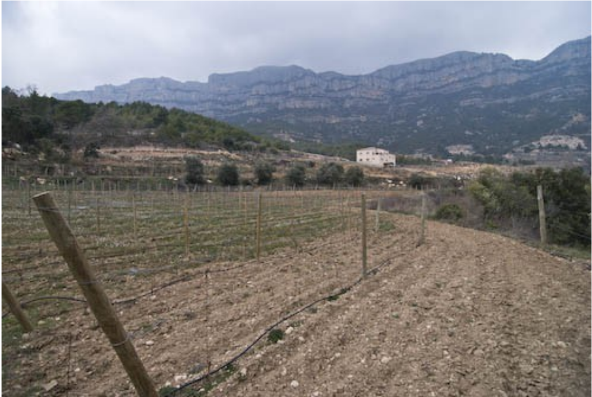
Die Reben für die meisten Ametller-Weine sind rings um das Keller-Gebäude... (FK)