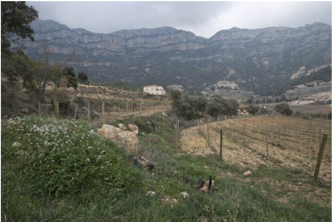
...inmitten herrlicher Landschaft mit Blick auf die Montsant - Felsen zu finden. (FK)