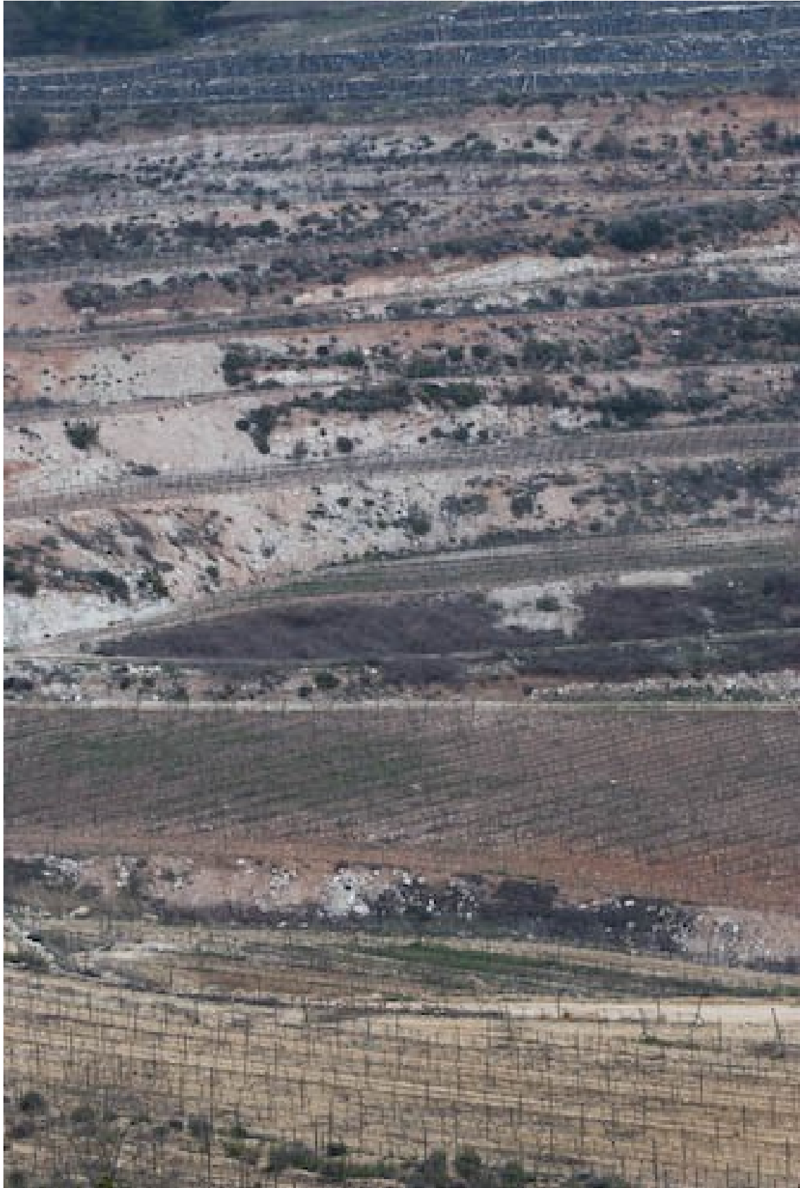
Im Februar wirken die Farben des Bodens sehr intensiv auf den Betrachter.