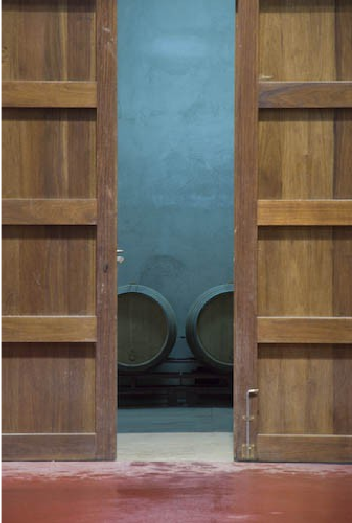
Blick in den Fasskeller...