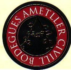
Els Igols; rot