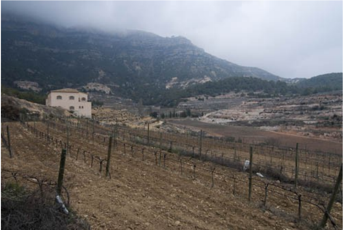
Lehmig – kalkige Böden mit Kieseln aus dem Konglomerat...