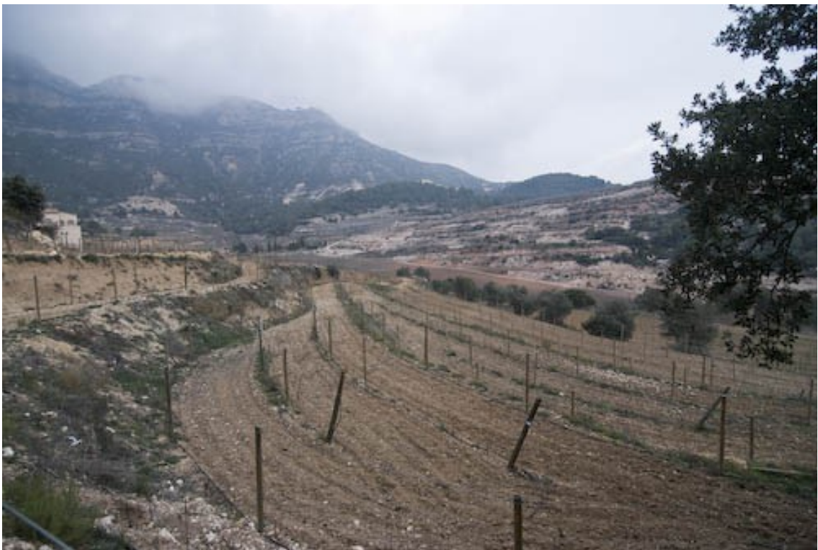
Die Böden sind stark durch das Montsant Massiv geprägt.