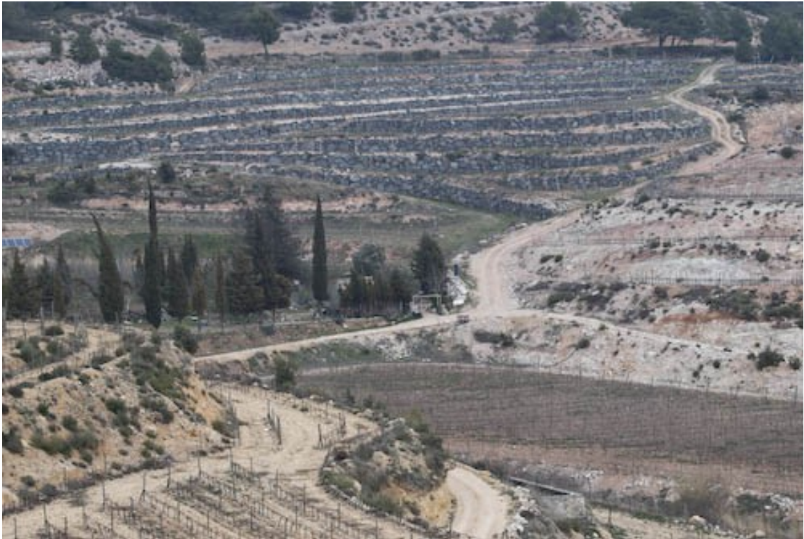
...in weiß, grau bis ocker und braunen Farben.