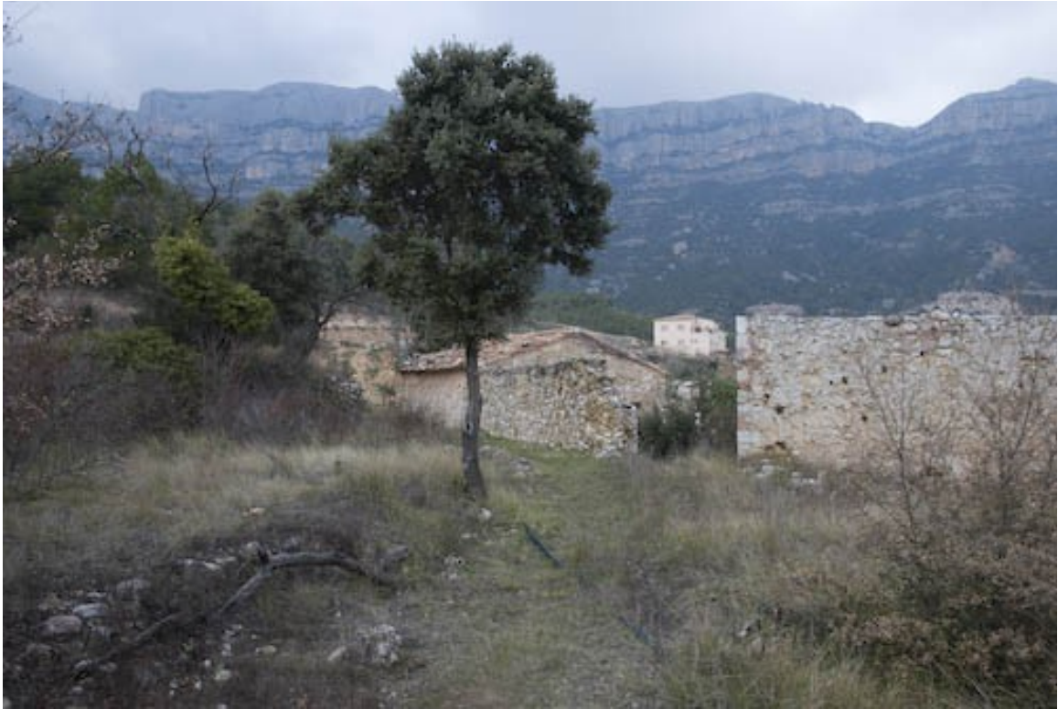
Die Landschaft fordert förmlich zu einer Entdeckungstour auf.